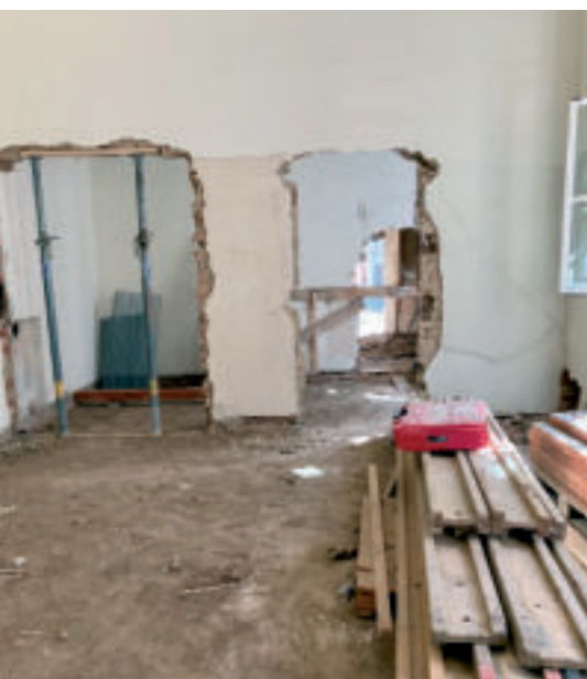
Neue Türöffnungen wurden gemacht und Wände wurden niedrigergerissen.