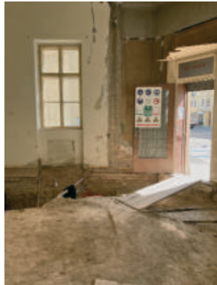
Für einen barrierefreien Eingang muss die Decke abgesenkt werden.

Zuerst wurden einige Wände umgerissen, neue Öffnungen für Türen gemacht und später wurden die alten zugemauert. Die Böden mit bis