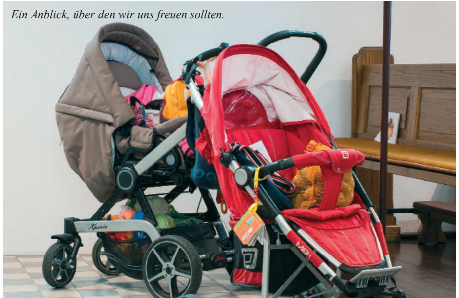
Ein Anblick, über den wir uns freuen sollten.

Vaterunser zum Beispiel nach vorne kommen und gemeinsam einen Kreis bilden – das ist immer ein besonderer Moment. Oder der Klingelbeutel-Dienst: eine kleine Aufgabe, aber mit großer Wirkung. Ministrieren ist sowieso eine super Möglichkeit, den Gottesdienst aus nächster Nähe mitzuerleben.